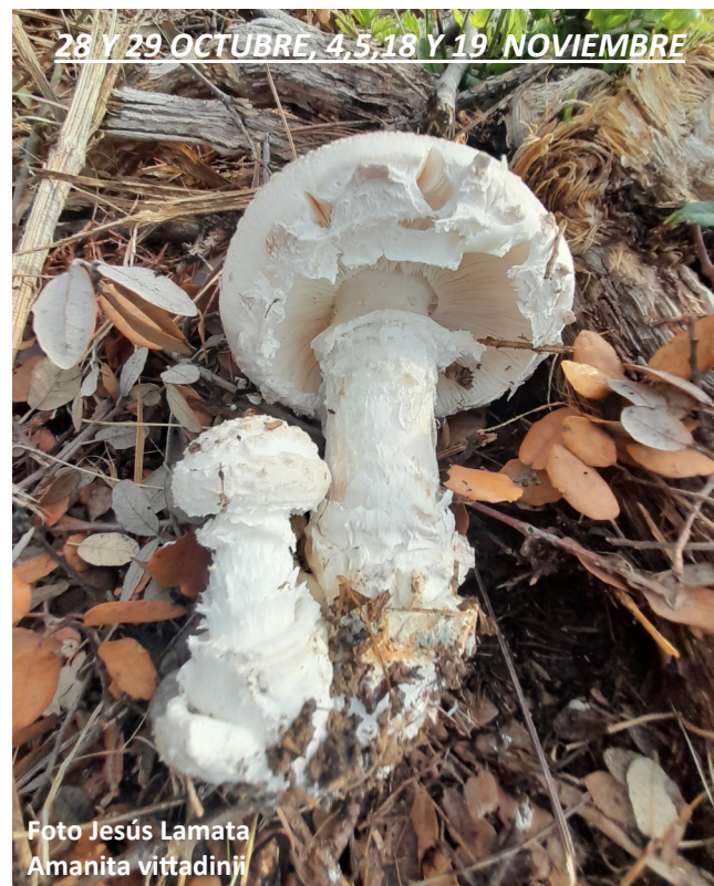
Amanita vittadinii